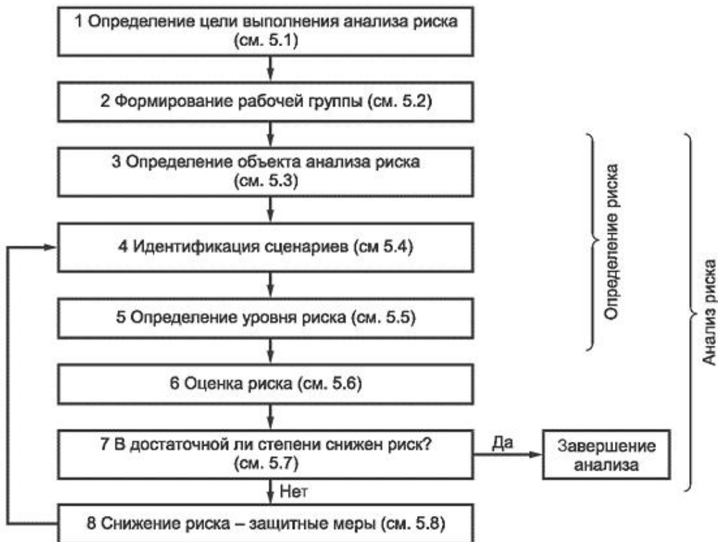
Рисунок 1 - Схема выполнения анализа и снижения риска